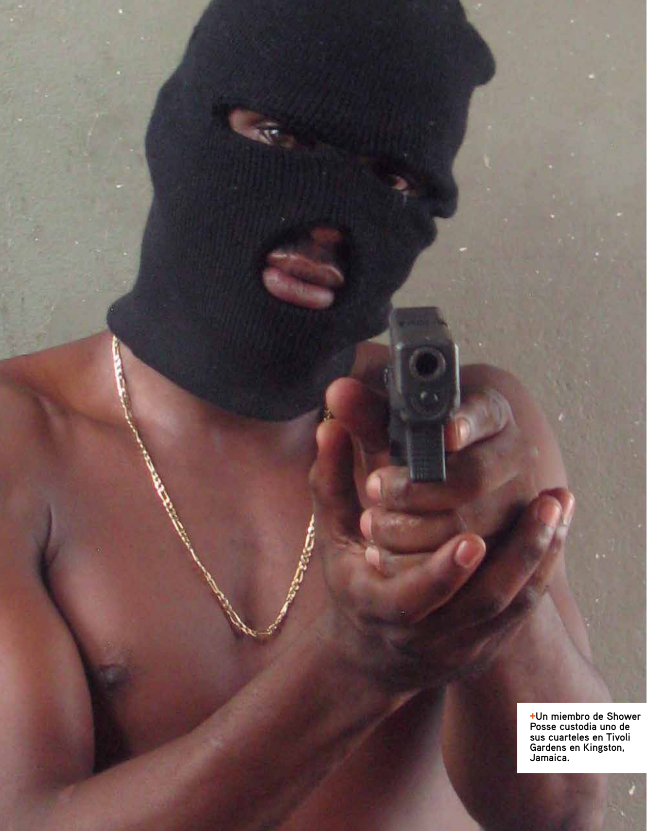
✚Un miembro de Shower Posse custodia uno de sus cuarteles en Tivoli Gardens en Kingston, Jamaica.