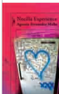
Nocilla Experience Alfaguara, Madrid, 2008, 205 pp.

1 La escena es tan hermosa que provoca náuseas.