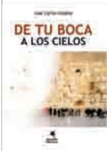
José Carlos Cataño De tu boca a los cielos Anroart, Tenerife, 2007, 225 pp.

Para hablar de su novela De tu boca a los cielos el escritor José Carlos Cataño afirma: “se trata de la primera novela sefardí en la literatura española”. A primera vista se diría que alude a un detalle exótico. Pero no es eso, ni mucho menos. La afirmación se dirige, críticamente, a un objetivo muy claro. El olvido completo del mundo sefardí en la construcción cultural española durante cuatro siglos. Después de la expulsión y la persecución inquisitorial de los judíos hubo que esperar a la campaña española en África y la toma de Tetuán en 1860 para que los españoles escucharan su lengua, con ecos a la vez próximos y extrañamente distantes, en las juderías de Marruecos. Ese olvido secular significaba, de algún modo, una complicidad constante con la expulsión.