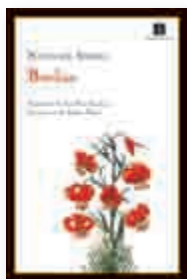
Natsume Sôseki Botchan, Traducción de José Pazó, Impedimenta, 2008, 240 pp.

No conozco historiador de la literatura que no vea en Natsume Sôseki (1867-1916) al padre de la novela japonesa moderna, y he hablado con pocos lectores de sus libros que no los recuerden con gratitud y afecto. Es fácil compartir esa simpatía, que pronto se extiende de los libros al autor, y difícil no admirar las minuciosas virtudes y la vasta influencia de una obra que, en una carrera literaria de doce años, se construyó contra las convenciones del gusto de su época, para cambiarlas definitivamente, y a la que cabe ver no sólo como una empresa personal sino como el proyecto de una entera literatura. Quiero decir que Natsume Sôseki fue más que un novelista.