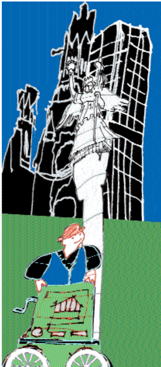
Ilustraciones: LETRAS LIBRES / Justo Barboza

hasta que acabe su refacción (como aquella sábana de Cristo que envolvía el Reichstag durante su puesta al día) y leo su inscripción en gruesas letras negras: “Nosotros conectamos”, pienso en el mensaje histórico que esto encierra. La inscripción no conecta: más bien delata. Cuando una tela capitalista debe anunciar sobre un monumento histórico recubierto de punta a punta lo que ese monumento, puerta