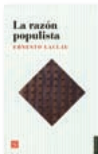
Ernesto Laclau La razón populista trad. Soledad Laclau, México, Fondo de Cultura Económica, 2005, 312 pp.

La palabra populismo es una nube de asociaciones detestables. Es demagogia, irresponsabilidad, rechazo a la negociación institucional, desprecio de las sumas y las restas, adoración de un caudillo. No hay ejercicio sobre el contenido de la palabra que no parta de la dificultad de encontrarle un marco. Es un concepto impreciso —si es que llega a ser concepto. Con la palabra se ha designado una vasta variedad de experiencias políticas: un movimiento intelectual de apreciación del campesinado ruso, una organización de granjeros racistas en Estados Unidos, muchos gobiernos latinoamericanos a lo largo del siglo XX y diversos movimientos de la derecha radical en Europa. Populismos de derecha y de izquierda.