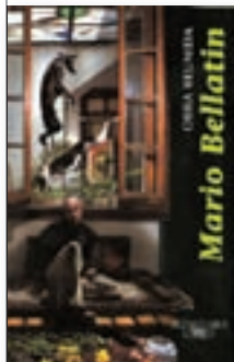
Mario Bellatin Obra reunida México, Alfaguara, 2005, 528 pp.

1. Habría que preguntarse, en principio, cuál es el motor de esta literatura. Si hacemos caso, con las reservas convenientes, a ciertos pasajes de Underwood portátil. Modelo 1915 (2005), a Mario Bellatin le atrajo, antes que el perfil creativo de la escritura, su mecánica, el acto en sí, la pulsión física que dispara caracteres sobre la página. Tuvo la fortuna, entonces, de realizar sus primeros ejercicios en una máquina que, a diferencia de la computadora, da a la acción de escribir un sentido