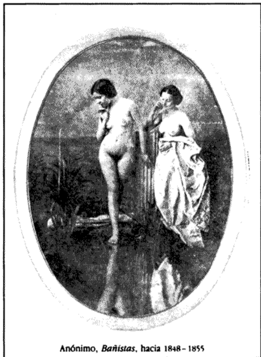
Anónimo, Bañistas , hacia 1848-1855

De por sí cuando sale a comprar pisolabis es como un maniquí, un autómatas hurao que visto desde arriba sería el