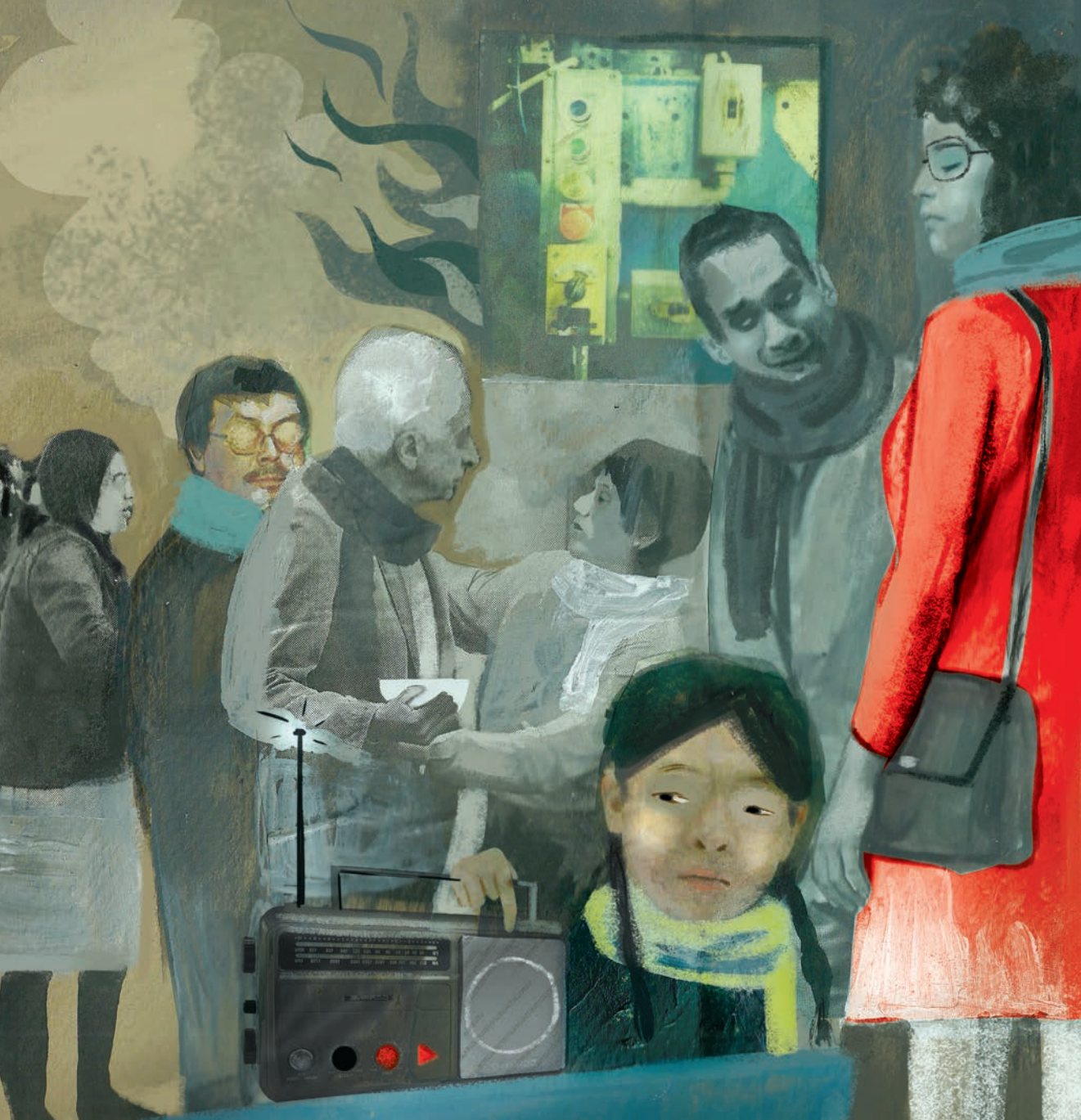
Ilustración: LETRAS LIBRES / Nora Milán

por cobijas, lloraban; tres o cuatro hombres escupían, murmuraban obscenidades. Nadie se acercó a dar su versión a la policía, nadie hizo otra cosa que echarse atrás y negar con la cabeza cuando los agentes preguntaban si habían escuchado, visto, oído lo que fuera.