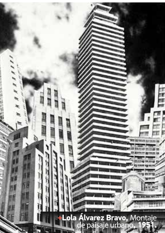
+Lola Álvarez Bravo, Montaje de paisaje urbano, 1951.

remoniales; las grandes obras de infraestructura hidráulica en Texcoco; el papel de Chapultepec. Nos quedamos con representaciones de dioses y un intento por hablar de la vida cotidiana a través de ellos.