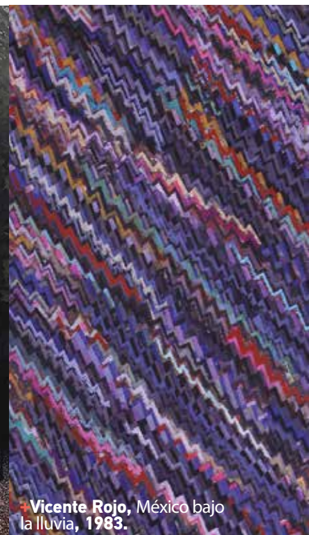
Vicente Rojo, México bajo la lluvia , 1983.