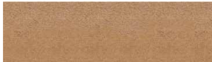
Ilustración: LETRAS LIBRES / María Titos

La conversación con Gabriel [Zaid] –me imagino que te habrá contado que habló conmigo por